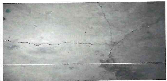
Foto 6: Torta de piso de concreto deteriorado, sustitución de piso completamente.

Observación: Si es necesario se pueden agregar hojas adicionales y actualizar el número de hojas.