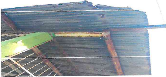
Foto1: Parte frontal de un módulo de aula, lámina en malas condiciones.