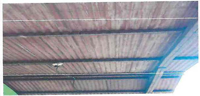
Foto 2: Estructura metálica oxidada, se necesita mantenimiento a la misma.