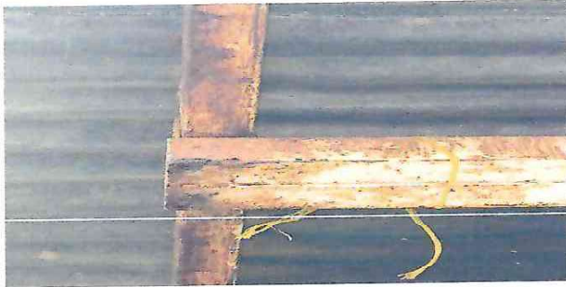
Foto 3: Costanera en mal estado, oxidadas y con agujeros, se necesita sustitución de estructura de soporte.