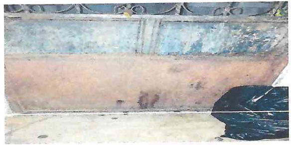
Foto 4: Puerta de metal ingreso a aula de Preprimaria en mal estado, sustituirla por nueva.